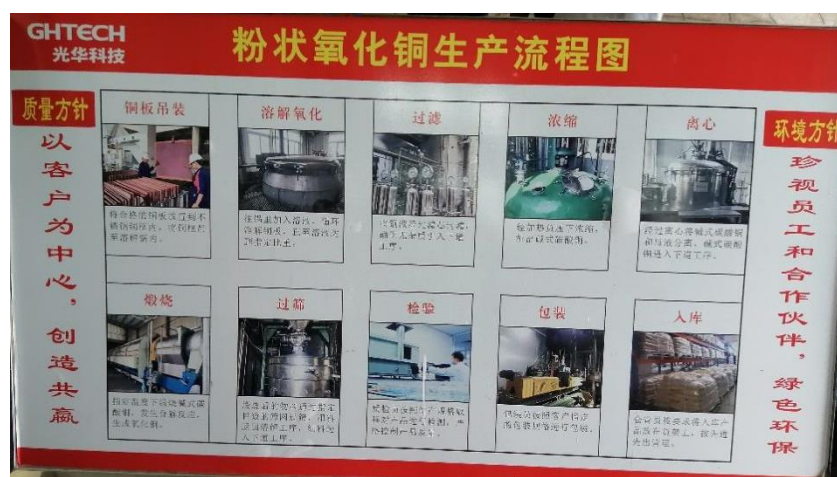
图 1 深入学习粉状氧化铜生产流程

光华科技自 2008 年开始在国内推出高纯氧化铜，是国内最早推出应用于 PCB 领域的企业之一，以其优良的品质迅速赢得市场，并取得良好口碑。在 PCB 领域，光华科技已与全球多家知名标杆客户达成长期战略合作关系，并获得非常高的肯定与认可。2014 年，光华科技通过自主研发设计，建成国内首条氧化铜全自动化生产线，采用先进的设备、数字化的管理系统和严格的质量控制流程，以高纯电解铜为原料，保证产品纯度及品质稳定。氧化铜的生产流程图如下图 1。