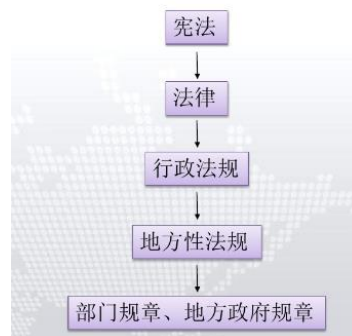
我国法律的法律效力的层级