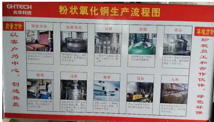
图 1 深入学习粉状氧化铜生产流程

光华科技自 2008 年开始在国内推出高纯氧化铜，是国内最早推出应用于 PCB 领域的企业之一，以其优良的品质迅速赢得市场，并取得良好口碑。在 PCB 领域，光华科技已与全球多家知名标杆客户达成长期战略合作关系，并获得非常高的肯定与认可。2014 年，光华科技通过自主研发设计，建成国内首条氧化铜全自动化生产线，采用先进的设备、数字化的管理系统和严格的质量控制流程，以高纯电解铜为原料，保证产品纯度及品质稳定。氧化铜的生产流程图如下图 1。